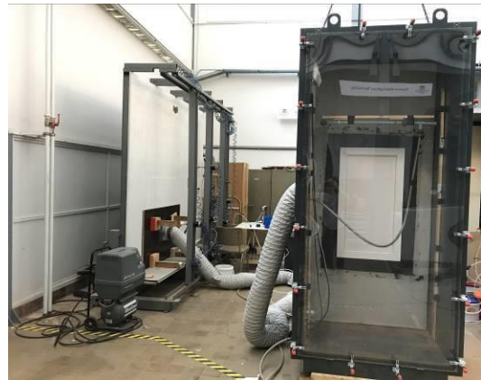
Figure 3: Montage d'essai